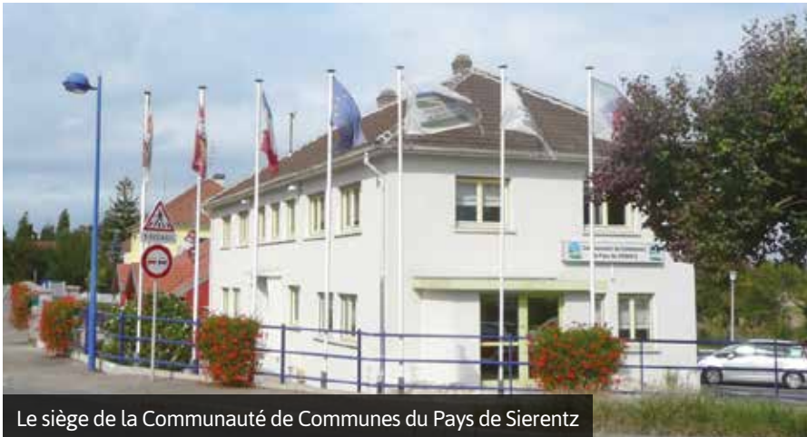
Le siège de la Communauté de Communes du Pays de Sierentz