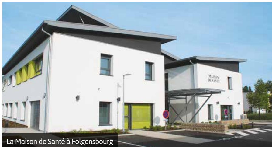
La Maison de Santé à Folgensbourg