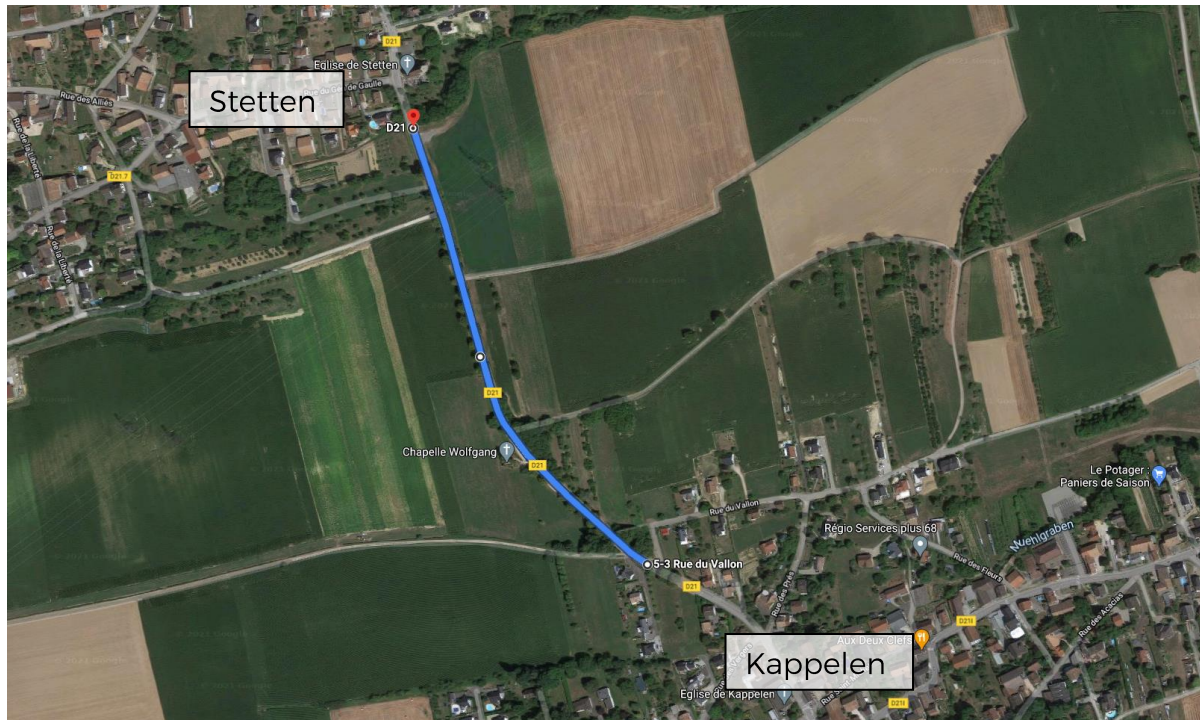
Kappelen - Stetten